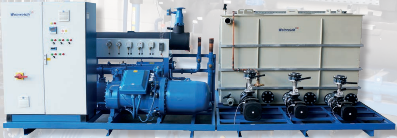
KSL-300 mit Schraubenverdichter und Pumpentankanlage