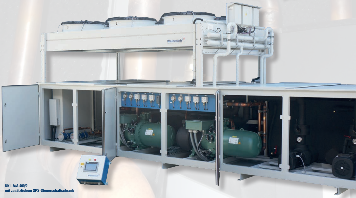
KKL-A/A 400/2 mit zusätzlichem SPS-Steuerschrank